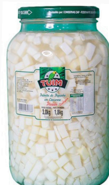
REF: 5262 Palmito de Pupunha Picado Tuim 1,8kg 6x1,8kg