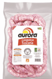
REF: 3857 Linguiça Toscana Aurora