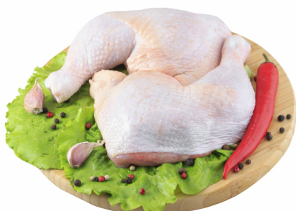
CONSULTE-NOS Coxa e Sobrecoxa Individual