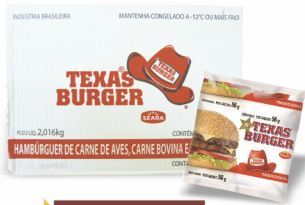
REF: 5671 Hambúrguer Bovino Texas Burger Seara - 56g 36x56g