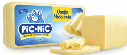
REF: 6274 Queijo Mussarela Pic-Nic