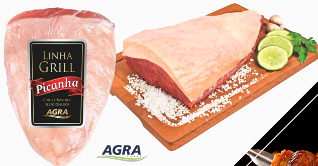
REF: 5592 Picanha Bovina Resfriada Grill Agra