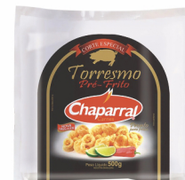
REF: 5112 Torresmo Pré-frito Chaparral - 500g 12x500g