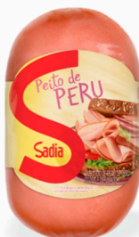
REF: 6235 Peito de Peru Defumado Sadia