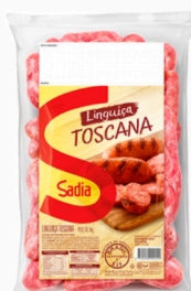
REF: 674 Linguiça Toscana Sadia