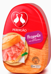
REF: 726 Presunto Cozido Perdigão