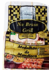
REF: 5849 Espeto de Medalhão de Mandioca Na Brasa Grill