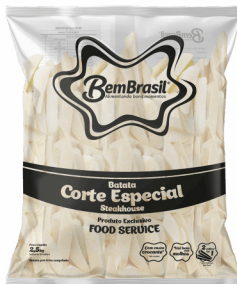
REF: 6113 Batata Corte Especial Bem Brasil Pacote 2,5kg 6x2,5kg