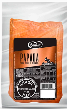
REF: 6519 Bacon Papada Suína c/ Pele Sulita