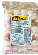
REF: 51 Medalhão de Frango Itabari