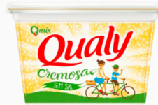
REF: 4211 Margarina sem Sal Qualy 500g caixa c/12