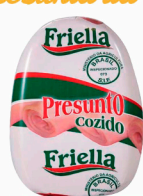
REF: 5914 Presunto Cozido Friella Oval