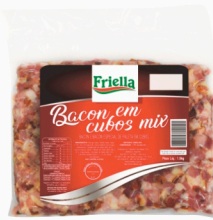
REF: 2504 Bacon em Cubos Mix Friella