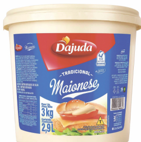
REF: 5012 Maionese D'ajuda Balde 3kg