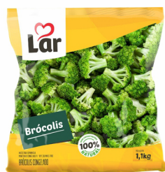
REF: 643 Brócolis Congelado Lar Pacote 1,1kg 10 x 1,1kg