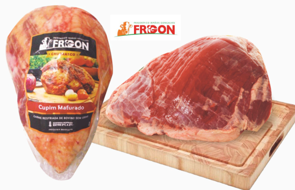
REF: 6494 Cupim Resfriado Maturado Frigon