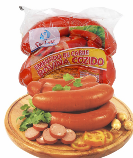
REF: 159 Linguiça Cambui São Luiz