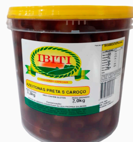
REF: 5963 Azeitonas Pretas Sem Caroco Ibiti Balde 2kg