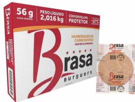
REF: 177 Hambúrguer Bovino Brasa Burguers - 56g 36x56g