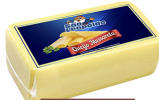
REF: 1467 Queijo Mussarela São Leopoldo