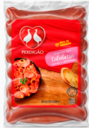
REF: 2663 Linguiça Calabresa Curva Perdigão - 18kg