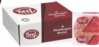
REF: 3972 Hambúrguer Bovino Mister Beef 56g