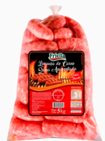
REF: 5589 Linguiça Toscana Apimentada Friella