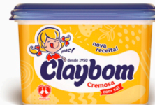
REF: 4213 Margarina com Sal Claybom 500g caixa c/12