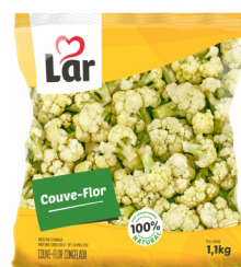
REF: 644 Couve Flor Congelada Lar Pacote 1,1kg 10 x 1,1kg