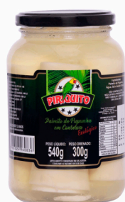
REF: 5263 Palmito de Pupunha Inteiro Piriquito 300g 15x300g