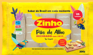
REF: 4280 Pão de Alho Zinho Tradicional - 300g 12x300g