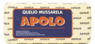
REF: 6418 Queijo Mussarela Apolo