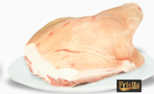
REF: 41 Paleta Suína Com Osso