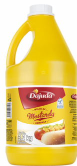
REF: 5011 Mostarda D'ajuda Galão 3,2kg