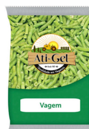
REF: 5909 Vagem Inteira Congelada Ati-Gel - Pacote 2,5kg 4x2,5kg