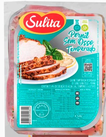
REF: 6182 Pernil Suíno Sem Osso Temperado Congelado Sulita