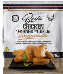
REF: 2490 Chicken de Frango com Queijo Empanado Baita Pacote 1kg