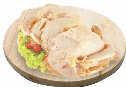
CONSULTE-NOS Filé de Coxa Congelado