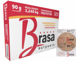
REF: 393 Hambúrguer Bovino Brasa Burguers - 90g 36x90g