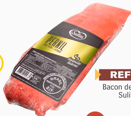
REF: 97 Bacon de Pernil Sulita