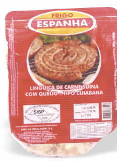
REF: 4188 Linguiça Tipo Cuiabana Suína Frigo Espanha 900g 12x900g