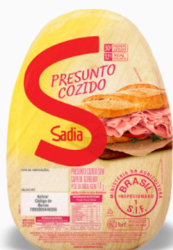
REF: 372 Presunto Cozido Sadia