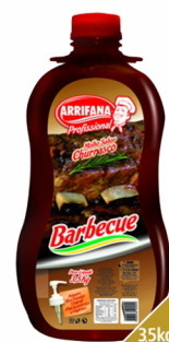
REF: 5557 Barbecue Arrifana Galão 3,5kg