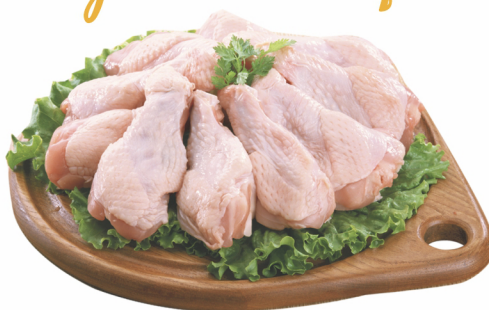
CONSULTE-NOS Coxinha da Asa Individual