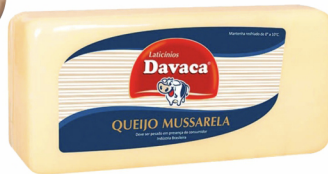
REF: 5061 Queijo Mussarela Davaca