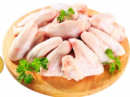
CONSULTE-NOS Asa Congelada Individual