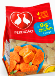
REF: 2490 Big Chicken c/ Queijo Perdigão