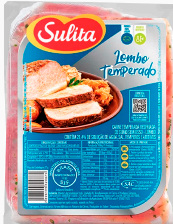
REF: 6181 Lombo Suíno Temperado Congelado Sulita