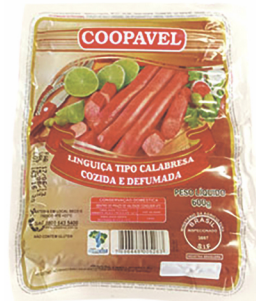
REF: 4787 Linguiça Calabresa Curva Coopavel 20kg