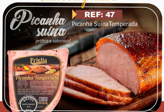
REF: 47 Picanha Suína Temperada