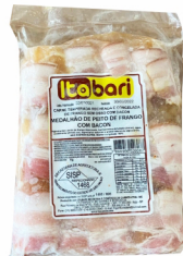
REF: 2726 Espeto de Medalhão de Frango Itabari