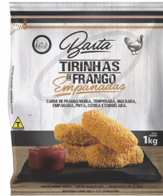
REF: 1547 Tirinhas de Frango Empanadas Baita Pacote 1kg