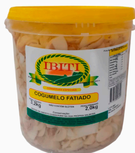
REF: 5008 Champignon Fatiado Ibiti Balde 2kg