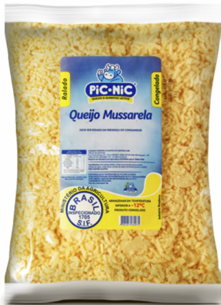
REF: 6275 Queijo Mussarela Ralada Congelada Pic-Nic