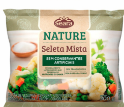
REF: 6317 Seleta Mista Congelada Seara Nature 300g 16 x 300g