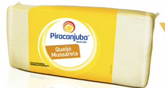
REF: 5531 Queijo Mussarela Piraanjuba