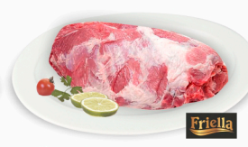
REF: 55 Copa Lombo Suíno Congelado com Osso