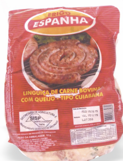
REF: 4187 Linguiça Tipo Cuiabana Bovina Frigo Espanha 900g 12x900g