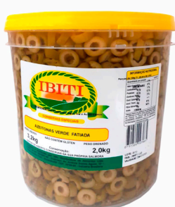
REF: 5004 Azeitonas Verdes Fatiadas Ibiti Balde 2kg