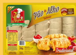
REF: 5876 Pão de Alho Hiper Tradicional 310g 12x310g