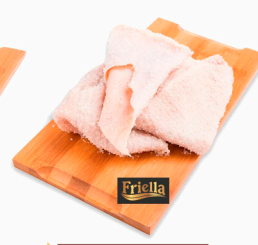
REF: 6024 Pele Suína Salgada Friella