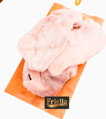
REF: 5110 Máscara Salgada de Suíno Friella