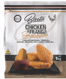
REF: 4104 Chicken de Frango Empanado Baita Pacote 1kg