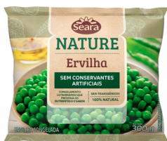
REF: 6222 Ervilha Fresca em Grãos Congelada Seara Nature 300g 18 x 300g