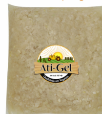
REF: 5908 Cebola em Cubos Ati-Gel - Pacote 2,5kg 4x2,5kg