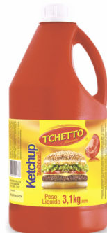
REF: 5575 Ketchup Tchetto Galão 3,1kg