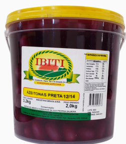
REF: 5966 Azeitonas Pretas Ibiti 12/14 Balde 2kg