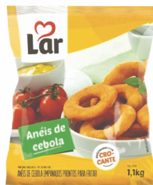
REF: 1723 Anéis de Cebola Lar Pacote 1,01kg 10x1,01kg