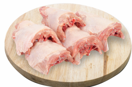
CONSULTE-NOS Dorso de Frango Congelado