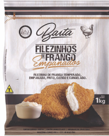
REF: 322 Filezinhos de Frango Empanados Baita - Pacote 1kg 10x1kg