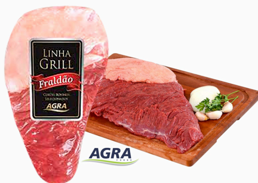
REF: 5563 Fraldão Bovino Resfriado Grill Agra