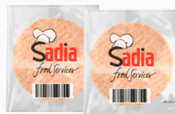
REF: 4418 Hambúrguer Bovino Sadia 56g