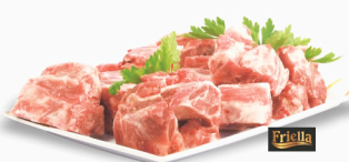
REF: 2378 Suan Suíno Congelado