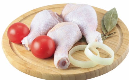
CONSULTE-NOS Coxa Pilão Individual