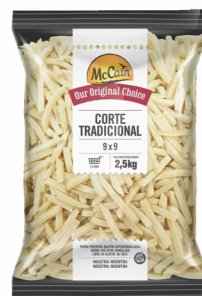
REF: 614 Batata Palito Mc Cain Pacote 2,5kg 6x2,5kg