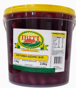
REF: 6380 Azeitonas Pretas Azzapa Ibiti 16/20 Balde 2kg