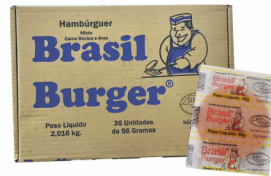
REF: 4236 Hambúrguer Bovino Brasil Burger - 56g 36x56g