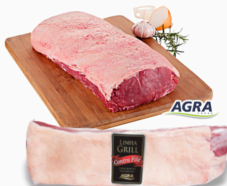
REF: 1990 Contra Filé Resfriado Grill Agra