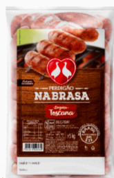
REF: 368 Linguiça Toscana Na Brasa Perdigão