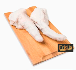
REF: 5107 Rabo Suíno Salgado Friella