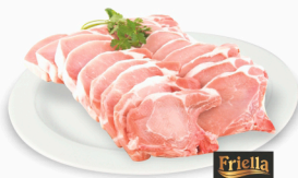
REF: 42 Bisteca Suína Congelada Serrada - 5kg