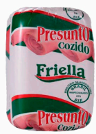
REF: 1227 Presunto Cozido Friella Retangular