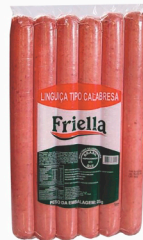
REF: 728 Linguiça Calabresa Reta Friella - 10kg