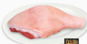
REF: 37 Pernil Suíno Com Osso