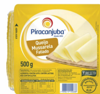
REF: 5662 Queijo Mussarela Fatiada Piraanjuba Emb. 500g 24x500g