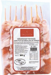
REF: 5848 Espeto de Medalhão de Frango Degusta 20x500g