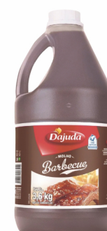
REF: 6254 Barbecue D'ajuda Galão 3,6kg