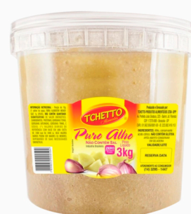
REF: 5235 Puro Alho Tchetto Balde 3kg