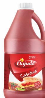
REF: 5010 Ketchup D'ajuda Galão 3,5kg