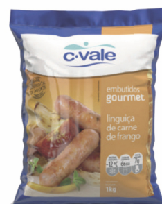
REF: 264 Linguiça de Frango Grossa C. Vale