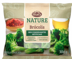
REF: 6223 Brócolis Congelado Seara Nature 300g 18 x 300g