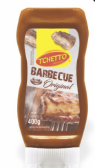
REF: 5093 Barbecue Tchetto 400g 12x400g