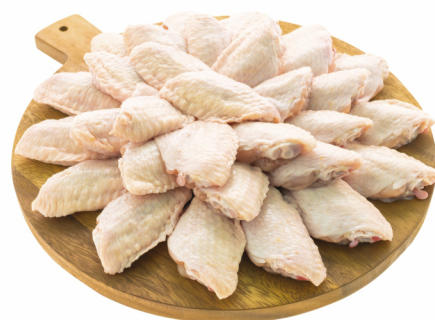
CONSULTE-NOS Tulipa de Frango Congelada - Pacote