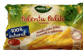
REF: 4494 Polenta Palito Congelada Arriço - Pacote 1kg 12x1kg