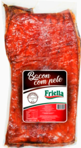
REF: 565 Bacon em Manta com Pele Friella