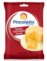
REF: 6414 Queijo Parmesão Ralado Piraanjuba Emb. 50g