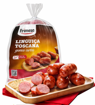
REF: 5216 Linguiça Toscana Gomos Curtos Frimesa - Pacote 5kg 20kg