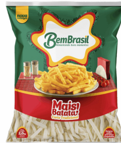
REF: 1517 Batata Palito Mais Bem Brasil Pacote 2kg 7x2kg