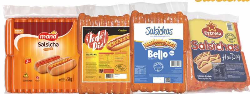
CONSULTE-NOS Salsicha Congelada Maná - Confina - Estrela - Bello