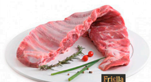
REF: 39 Costelinha Suína Congelada