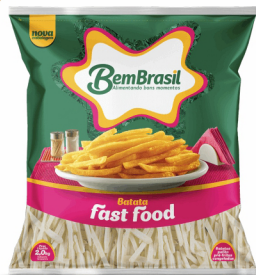
REF: 6249 Batata Palito Fast Food Bem Brasil Pacote 2kg 7x2kg