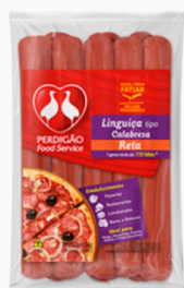
REF: 1428 Linguiça Calabresa Reta Perdigão - 7,5kg