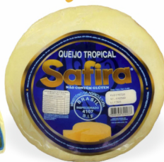
REF: 5458 Queijo Parmesão Tropical Safira caixa 5kg