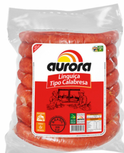
REF: 371 Linguiça Calabresa Curva Aurora 25kg