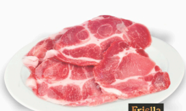
REF: 56 Copa Lombo Suíno Congelado Sem Osso