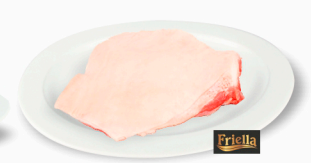
REF: 5030 Papada Suína Congelada