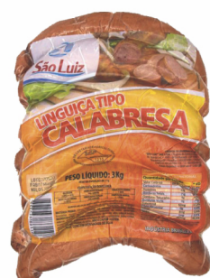
REF: 166 Linguiça Calabresa Curva São Luiz 15kg