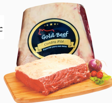
REF: 6375 Contra Filé Porcionado Grill Gold Beef