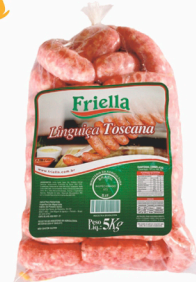
REF: 74 Linguiça Toscana Friella