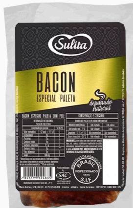
REF: 431 Bacon de Paleta Sulita