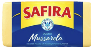
REF: 4234 Queijo Mussarela Safira