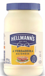
REF: 5376 Maionese Hellmann's Pet 500g 12x500g