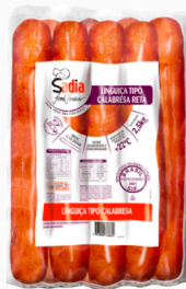
REF: 4520 Linguiça Calabresa Reta Sadia - 7,5kg