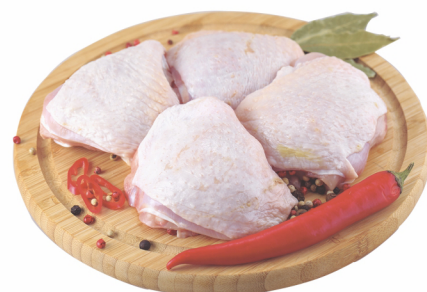
CONSULTE-NOS Sobrecoxa de Frango Congelada