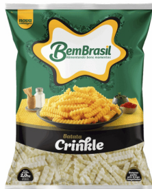
REF: 6112 Batata Palito Crinkle Bem Brasil Pacote 2kg 7x2kg