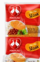
REF: 4216 Steak Empanado de Frango Perdigão 45x100g