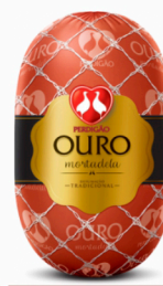
REF: 367 Mortadela Ouro Perdigão