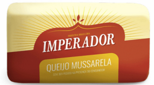
REF: 4428 Queijo Mussarela Imperador