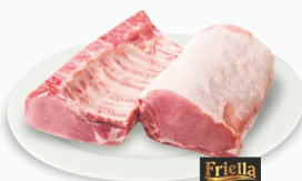
REF: 38 Carré Suíno Congelado