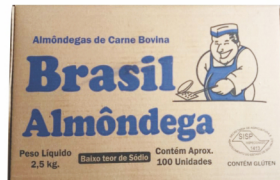
REF: 4239 Almôndega de Carne Bovina Brasil Burger 2,5kg