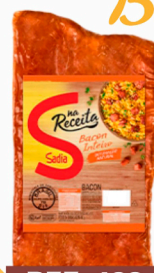
REF: 423 Bacon Manta Sadia - 10kg