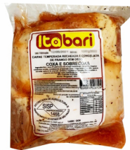
REF: 60 Brachola de Frango Itabari