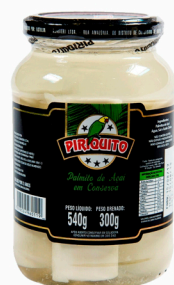
REF: 5261 Palmito de Açai Inteiro Piriquito 300g 15x300g