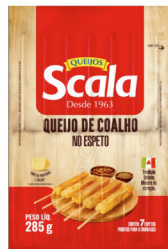
REF: 6217 Queijo Coalho Espeto Scala 16x285g