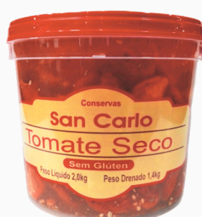
REF: 5276 Tomate Seco San Carlo Balde 2kg