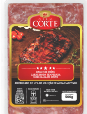
REF: 6332 Raggu Temperado de Carne Suína Gran Corte 8kg