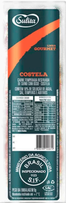
REF: 4610 Costela Suína Temperada Gourmet Sulita Congelada