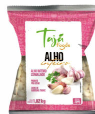
REF: 4901 Alho Inteiro Congelado Tajá Pacote 1,02kg 10x1,02kg