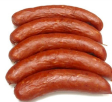
REF: 6330 Linguiça Calabresa Gran Corte 6,3kg