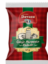
REF: 5498 Queijo Parmesão Ralado Grosso Davaca 20x50g