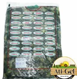
REF: 5321 Escarola Fatiada Ati-Gel - Pacote 2,5kg 5x2,5kg