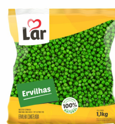
REF: 6408 Ervilha Congelada Lar Pacote 1,1kg 10 x 1,1kg