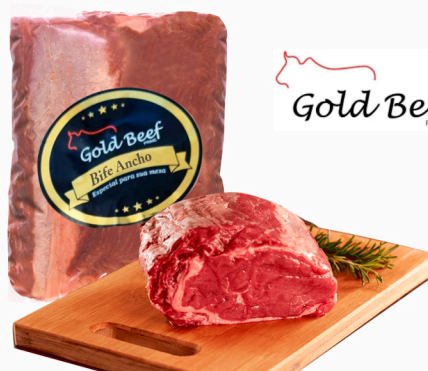
REF: 6497 Bife Ancho Grill Gold Beef