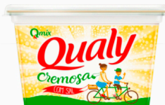
REF: 1456 Margarina com Sal Qualy 500g caixa c/12