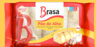
REF: 4554 Pão de Alho Brasa Tradicional 400g 12x400g