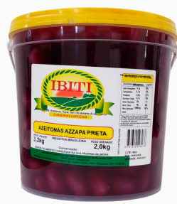
REF: 5965 Azeitonas Pretas Azzapa Ibiti Balde 2kg