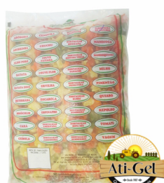
REF: 1592 Seleta de Legumes Ati-Gel - Pacote 2,5kg 4x2,5kg