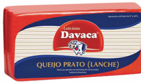
REF: 5062 Queijo Prato Davaca