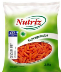
REF: 6261 Cenoura Baby Nutriz Pacote 2,5kg 4x2,5kg