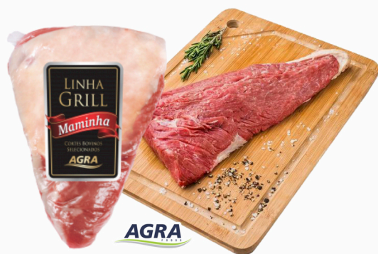
REF: 5562 Maminha Bovina Resfriada Grill Agra