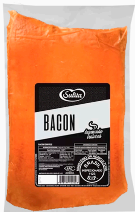
REF: 43 Bacon em Manta Sulita