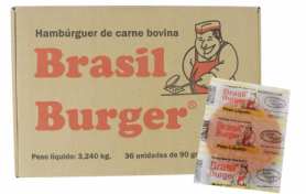
REF: 4237 Hambúrguer Bovino Brasil Burger - 90g 36x90g