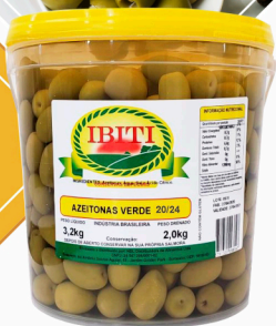
REF: 5006 Azeitonas Verdes c/ Caroco Ibiti 20/24 Balde 2kg