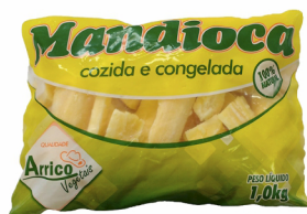
REF: 4497 Mandioca Cozida Congelada Arriço - Pacote 1kg 12x1kg