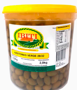
REF: 5009 Azeitonas Verdes c/ Caroco Ibiti 28/32 Balde 2kg