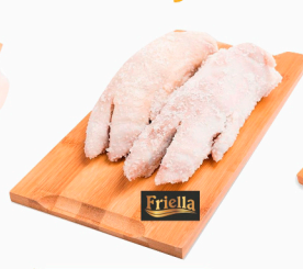
REF: 5109 Pé Suíno Salgado Friella