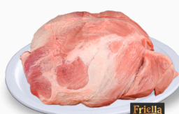
REF: 90 Paleta Suína Sem Osso