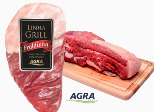
REF: 5560 Fraldinha Bovina Resfriada Grill Agra