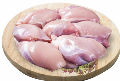
CONSULTE-NOS Filé de Coxa Sem Pele Congelado