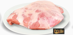
REF: 72 Pernil Suíno Sem Osso