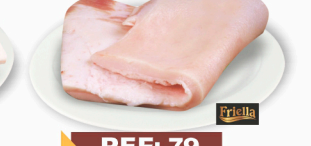
REF: 79 Toucinho Suíno Lombar Com Pele