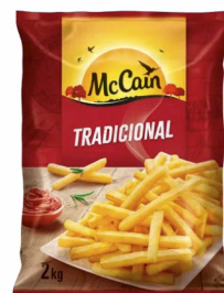
REF: 6243 Batata Palito Mc Cain Pacote 2kg 8x2kg