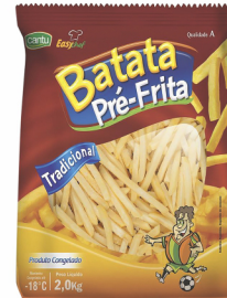
REF: 2739 Batata Palito Cantu / Easychef Pacote 2kg 6x2kg