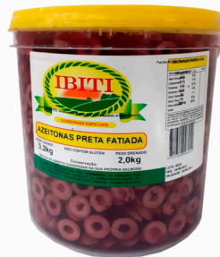
REF: 5964 Azeitonas Pretas Fatiadas Ibiti Balde 2kg