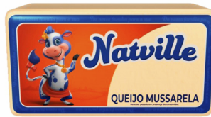
REF: 6303 Queijo Mussarela Natville