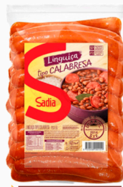
REF: 704 Linguiça Calabresa Curva Sadia - 15kg