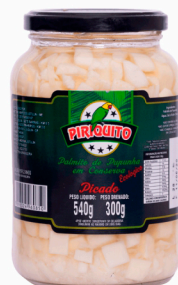
REF: 5262 Palmito de Pupunha Picado Piriquito 300g 15x300g