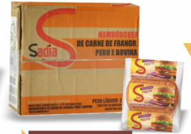
REF: 4418 Hambúrguer Bovino Sadia - 56g 36x56g