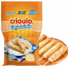
REF: 143 Queijo Coalho Espeto Crioulo 12x400g