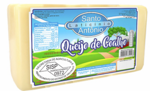
REF: 5053 Queijo Coalho Barra Santo Antônio