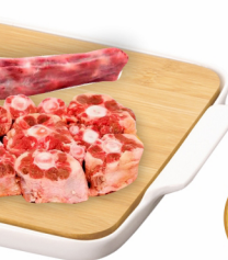
Rabo Bovino Congelado