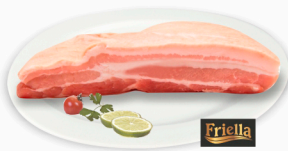
REF: 40 Barriga Suína Congelada