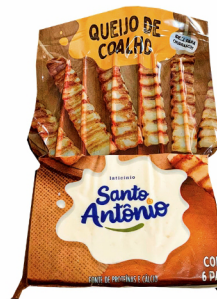
REF: 5827 Queijo Coalho Espeto Santo Antonio