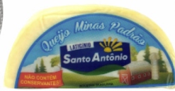
REF: 4130 Queijo Minas Santo Antonio caixa 5kg