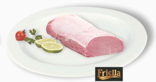
REF: 71 Lombo Suíno Congelado