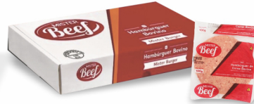
REF: 672 Hambúrguer Bovino Mister Beef 100g