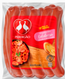
REF: 371 Linguiça Calabresa Curva Perdigão - 10kg