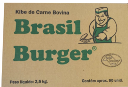
REF: 4238 Kibe de Carne Bovina Brasil Burger 2,5kg