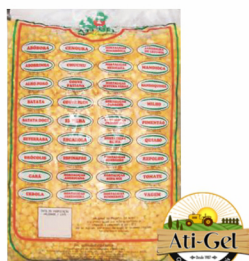
REF: 4242 Milho em Grãos Ati-Gel - Pacote 2,5kg 5x2,5kg