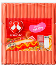
REF: 369 Salsicha Hot Dog Perdigão - 20kg