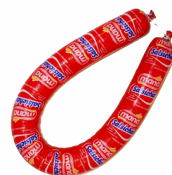
REF: 3717 Salsichão Maná