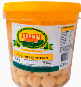
REF: 5007 Champignon Inteiro Ibiti Balde 2kg