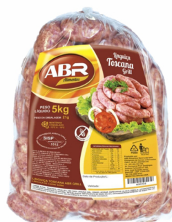
REF: 5995 Linguiça Toscana ABR Alimentos 10kg