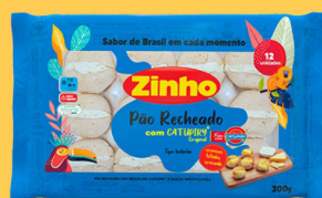
REF: 4338 Pão de Alho Zinho Recheado c/ Catupiry - 300g 12x300g