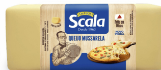
REF: 6218 Queijo Mussarela Scala