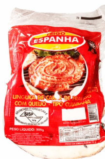
REF: 4079 Linguiça Tipo Cuiabana de Frango Frigo Espanha 900g 12x900g