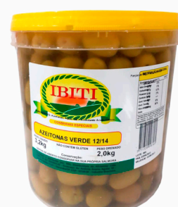
REF: 6341 Azeitonas Verdes c/ Caroco Ibiti 12/14 Balde 2kg