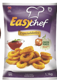
REF: 5126 Anéis de Cebola Cantu / Easychef Pacote 1,01kg 10x1,01kg