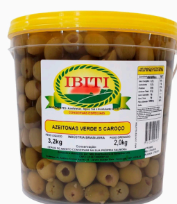
REF: 5005 Azeitonas Verdes Sem Caroco Ibiti Balde 2kg