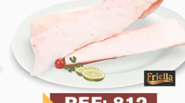
REF: 812 Toucinho Suíno Lombar Sem Pele