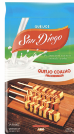
REF: 3819 Queijo Coalho Espeto San Diego