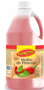
REF: 5576 Molho de Pimenta Caseiro Tchetto Galão 3,1L