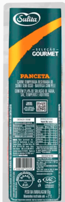
REF: 5587 Barriga Suína Temperado Gourmet Sulita Congelada (Panceta)