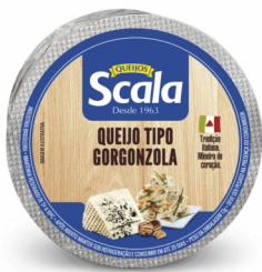
REF: 4884 Queijo Tipo Gorgonzola Scala