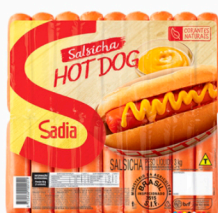
REF: 1429 Salsicha Resfriada Sadia